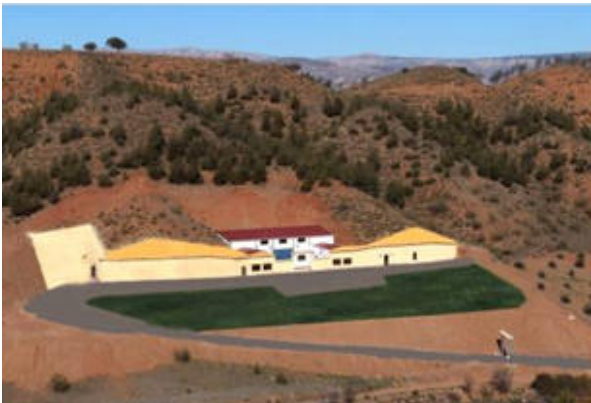
Bodegas Conde Sicilia S.L. (Cortes y Graena)