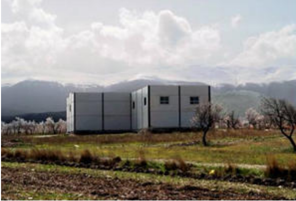
Bodegas Al-Zagal S.L. (Cogollos de Guadix)

El objetivo de estos dos proyectos ha sido la creación de dos bodegas de vino de en nuestra comarca, que además de generar nuevos empleos, están contribuyendo así a ampliar la oferta y consolidar la IGP “Vinos de la Tierra Norte de Granada”. En la actualidad la Comarca de Guadix se consolida, con estos y otros proyectos, como la zona de Granada donde este sector ha experimentado un mayor crecimiento, contando en la actualidad con una variada oferta de caldos, algunos de ellos de excelente calidad como así lo demuestra los numerosos premios cosechados en los últimos años.