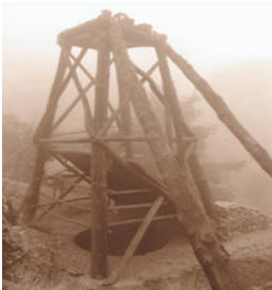
Foto: "Las Entrañas de la Tierra" Autor: José Antonio Lozano Sánchez