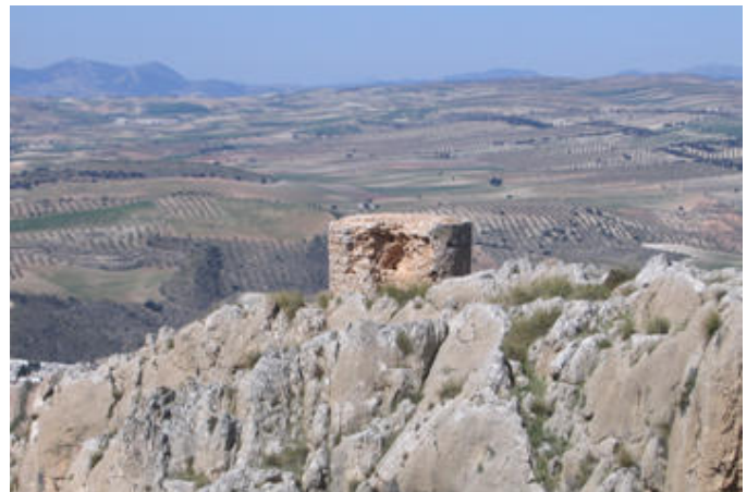
Área de vuelo libre El Mencil (Pedro Martínez)