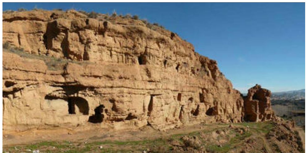
Vista general Los Covarrones de Cortes

La inversión total de los proyectos solicitados por los municipios de la comarca de Guadix asciende a un total de 1.610.493 euros, de los que se ha solicitado una subvención total de 1.111.613 euros, que corresponde aproximadamente al 70% del presupuesto previsto para cada proyecto.