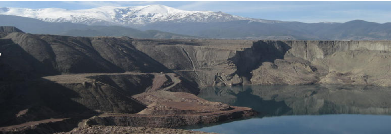
Minas de Alquefe

El GDR de Guadix como participante en esta acción conjunta de cooperación coordinada por el GDR de Riotinto (Huelva) participó el pasado día 9 de marzo en una reunión celebrada en Cabra (Córdoba), en la que se decidió ejecutar en los próximos meses una serie de acciones, entre las que podemos destacar la edición de un catálogo fotográfico de las zonas mineras de Andalucía, además de la edición de material didáctico