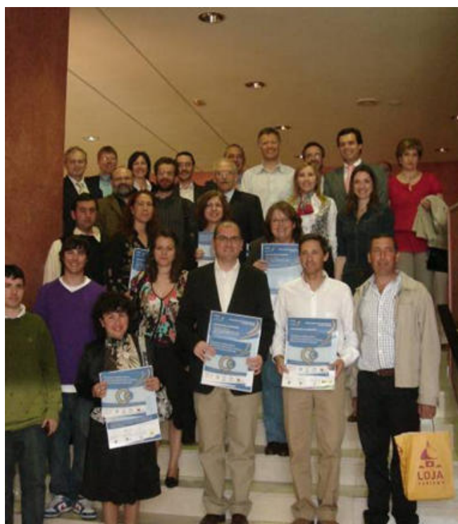
Entrega de diplomas acreditativos a establecimientos turísticos adheridos a la CETS en Andalucía.