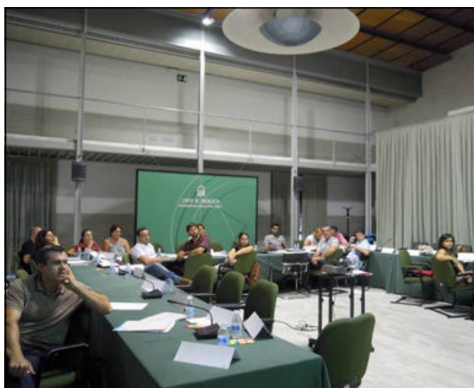
Exposiciones y trabajo en grupos.