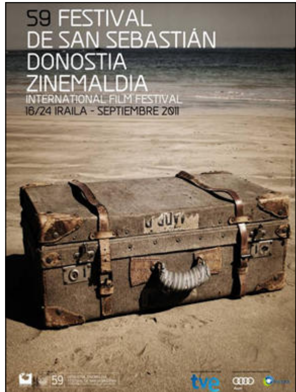
Cartel del 59 Festival de San Sebastián

Comarca de Guadix Film Office (entidad gestionada por la Asociación para el Desarrollo Rural de la Comarca de Guadix) se creó el pasado 4 de mayo de 2009 con el objetivo principal de promocionar las potencialidades de la Comarca como localización para todo tipo de obras audiovisuales y atraer así el mayor número de rodajes a la Comarca. Además, ofrece información, asesoramiento y asistencia gratuita en materia de localizaciones, permisos o servicios a las productoras de cine, video y televisión que deciden rodar en la zona.